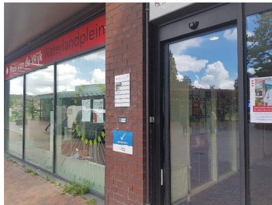
Voor een toelichting op de foto's in dit rapport, zie pagina 18

De laagdrempelige activiteiten in buurthuizen zouden bovendien een plek kunnen zijn om LVB vroegtijdig te signaleren en van waaruit bewoners toegeleid kunnen naar zwaardere vormen van ondersteuning en zorg (Movisie, 2018). Dat moet ertoe bijdragen dat het verdere verloop van eventuele hulpverlening beter ingericht kan worden en meer kans van slagen heeft (persoonlijke communicatie, beleidsmedewerker Gemeente Amsterdam, 12-12-2022).